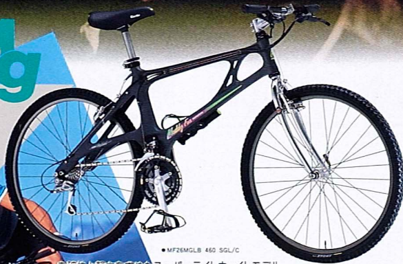
●MF26MGLB 460 SGL/C