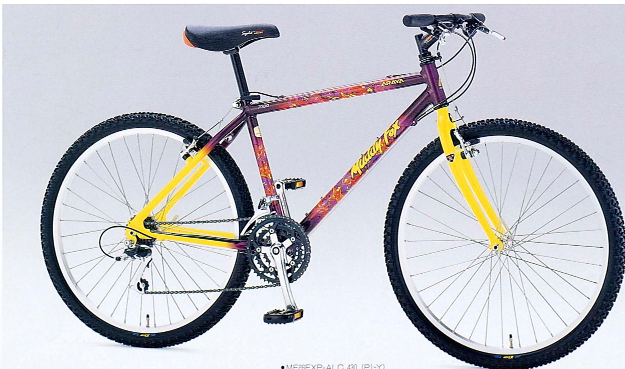
●MF26EXP-ALC 430 (P1-Y)