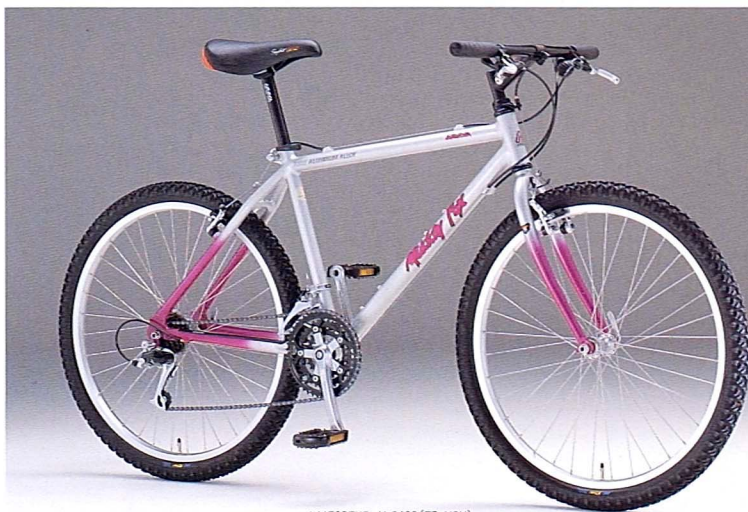
● MF26EXP-ALC460 (T3-VSV)