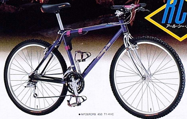
●MF26RCRB 450 T1-KVC

TIG溶接オールクロモリフレームにウルトラライトフォーク。 軽さと強さを追求したリアルレーシングモデル。