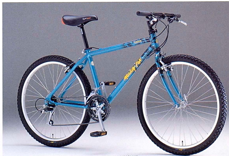
● MF26EXP-ALC430 (SCB)