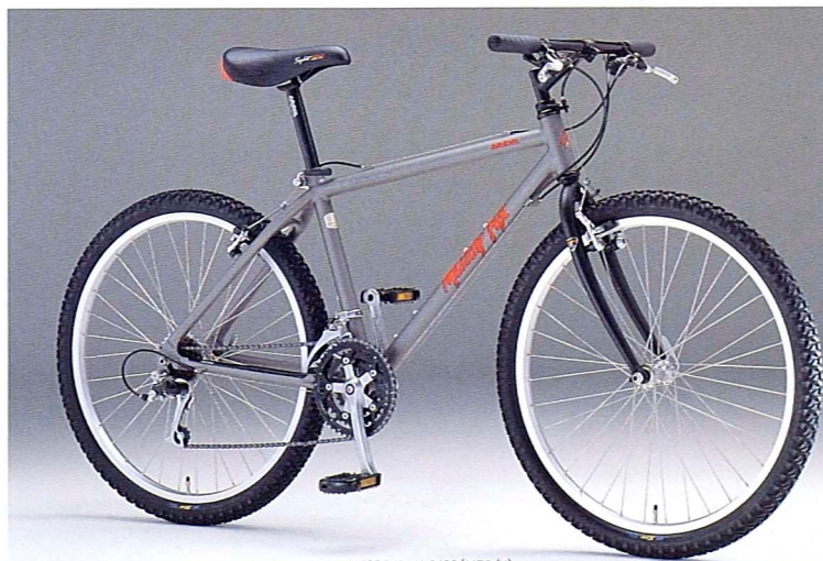
● MF26EXP-ALC430 (MTS/K)

手の平のフィット感を追求するとう言う形になった。シートピラーの上げ下げにたびたび動かすクイックレバーはこれにより一層の操作性をアップしている。