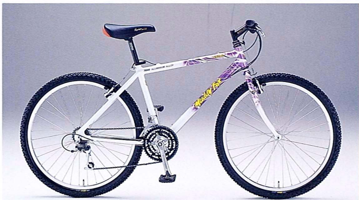
●MF26EXP-ALC 430 (SCV)