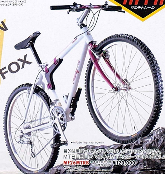
●MF26MTRB 440 POW/V

目的は単に走るだけではない。かきもろく走る。かきもろく走る。かきもろく走る。 MTB自由自在。マルチなMTBが、あなたをどこまでも連れて行く。 MF26MTRB 標準現金販売価格 ¥120,000 (消費税含まず)