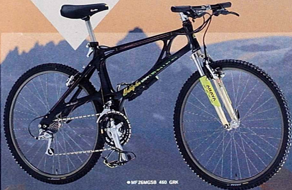
●MF26M6SB 450 GRK

自然とテクノロジーの融合した姿、 マグネシウム合金モノコック フレーム。 これは次代のためのMTBのさらなる進化だ。