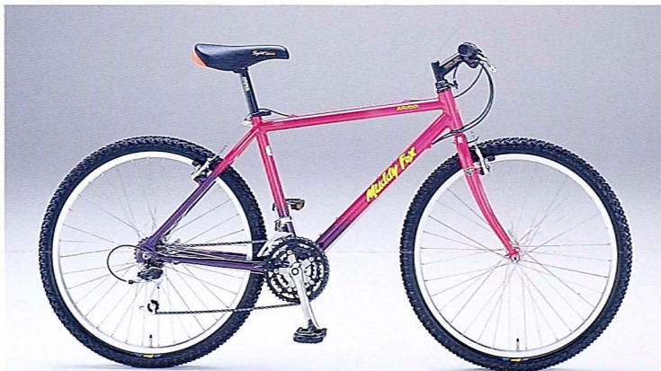
●MF26EXP-ALC 430 (T4-VPP)

ブレーキシューとのあたりを考えたサイドコンケーブデザインのVP-20リムが、確実な制動力を約束します。タイヤは、オフロードだけでなく、オンロードの走破性も考えた細かいブロックパターンのX1-KEYタイヤ。