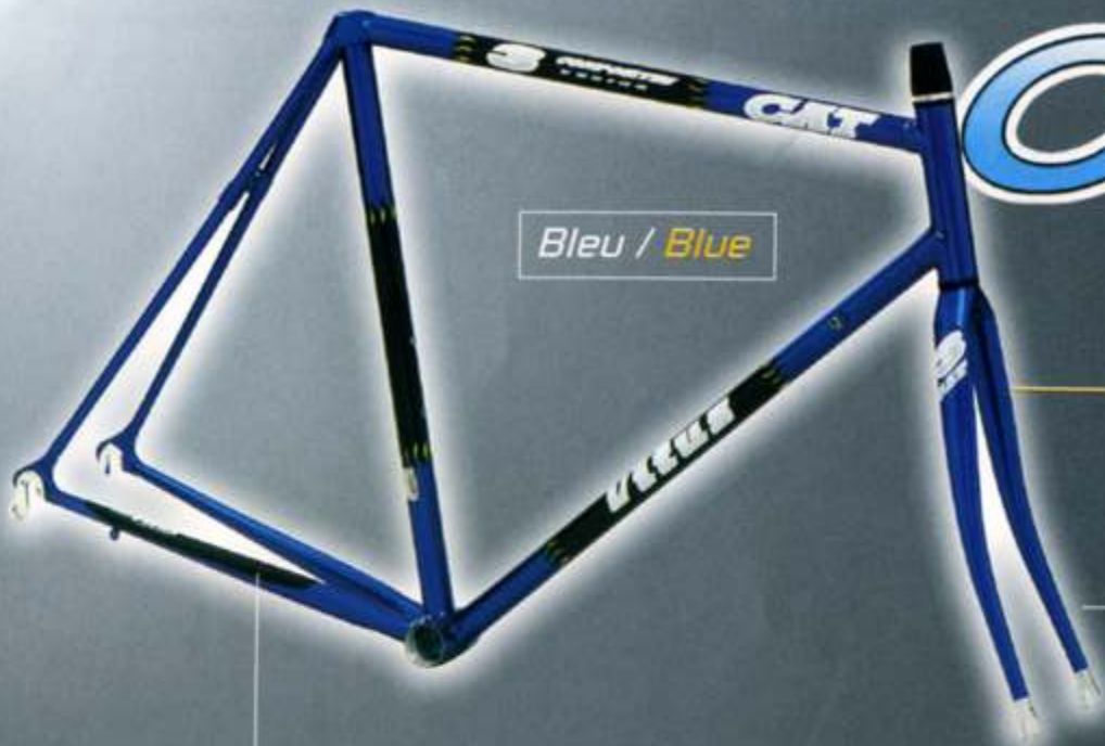
Bleu / Blue

The CAT 3 is made with three composite tubes for the main triangle ( filament winding technique ) and back of the frame in aluminium - Both provide rigidity and comfort - Removable rear drop-out - Also available with complete all carbon tubing.