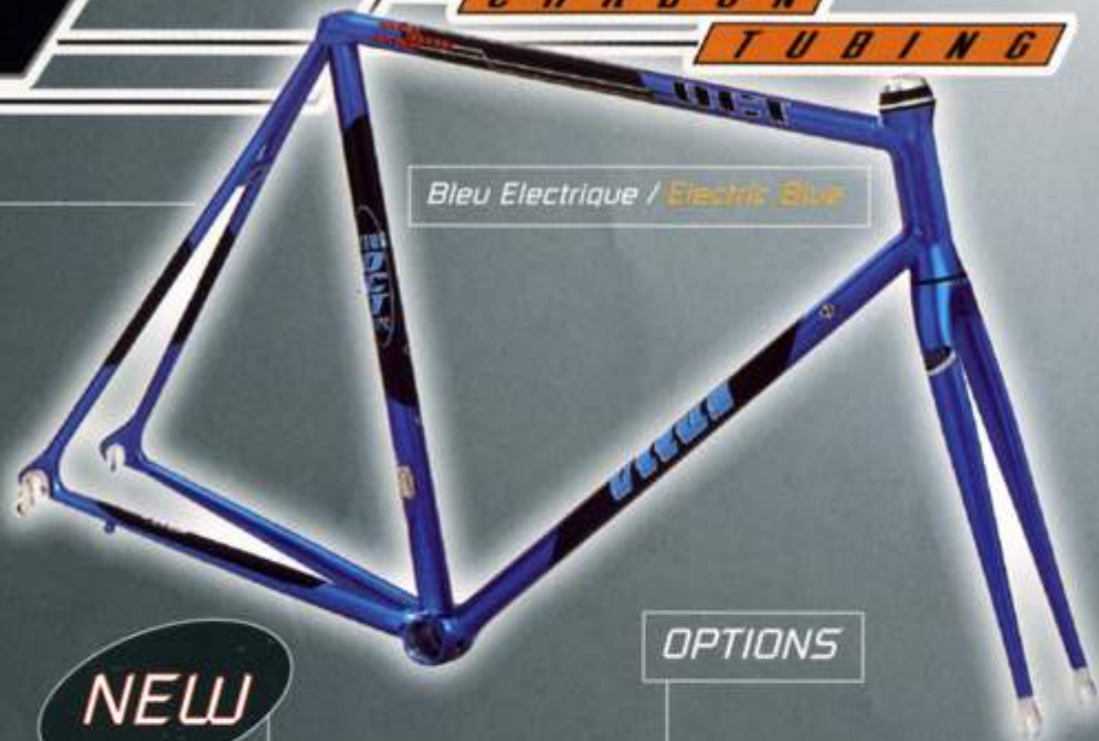
Bleu Electrique / Electric Blue

Lightweight - Stiffness - Stylisshness - Seven carbon tubes tapered and ovoid shape - Aluminium fork - Integrated headset (IHS) - Integrated front mounting bracket (VITECH process, VITUS) - Removable rear drop-out. - STI guides.