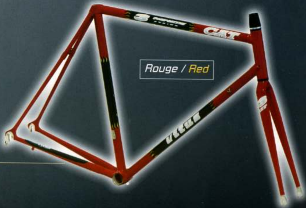
Rouge / Red

OPTIONS : Straight fork CHRONO - Upon request possibility to manufacture custom made frames - Seat pillar : ø 24,3 mm.