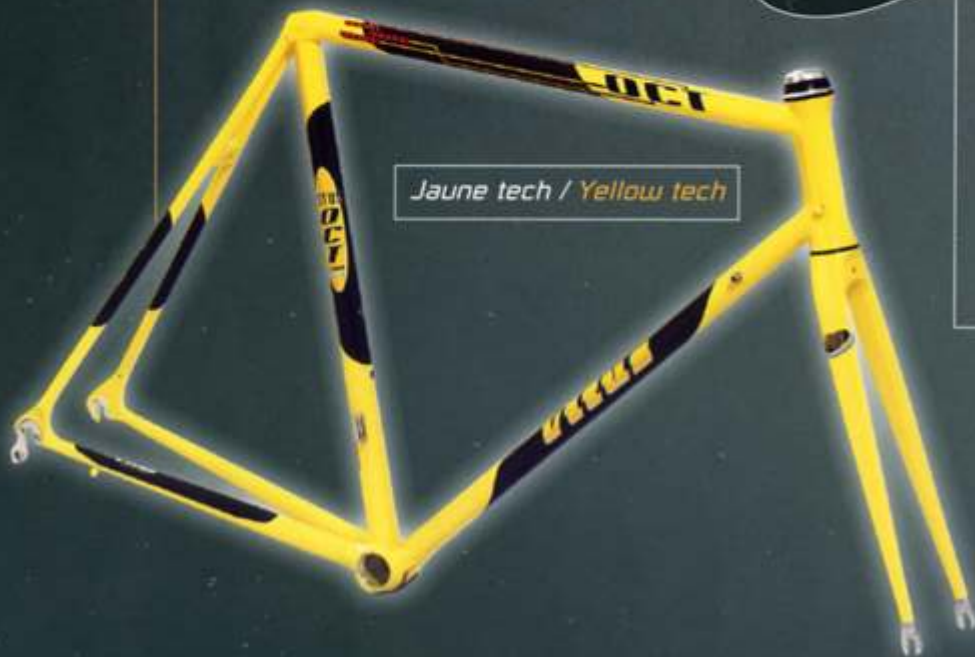
Jaune tech / Yellow tech

Fourche droite - Sur demande possibilité de fabriquer des cadres sur mesures - Tige de selle : ø 25 mm avec plat.