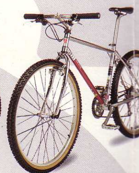
racing 5000 S

Cadre CROMO Tange DB, fourche CROMO, groupe Shimano STX, jantes Mavic 234, tige de selle, cintre et potence, Ahead set: SUNN Brute