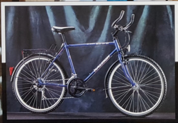
FM 1000 ROAD 24" J 36, M 36, Rahmenmaterial Hi-Ten, Shimano 15-Gang Index Gearing.

Bullhornlenker und federnde Gabeln sind nicht nur für erfahrene Mountainbiker selbstverständ- lich - auch die Kleinen kommen ganz groß raus mit den KID-Bikes von RALEIGH.