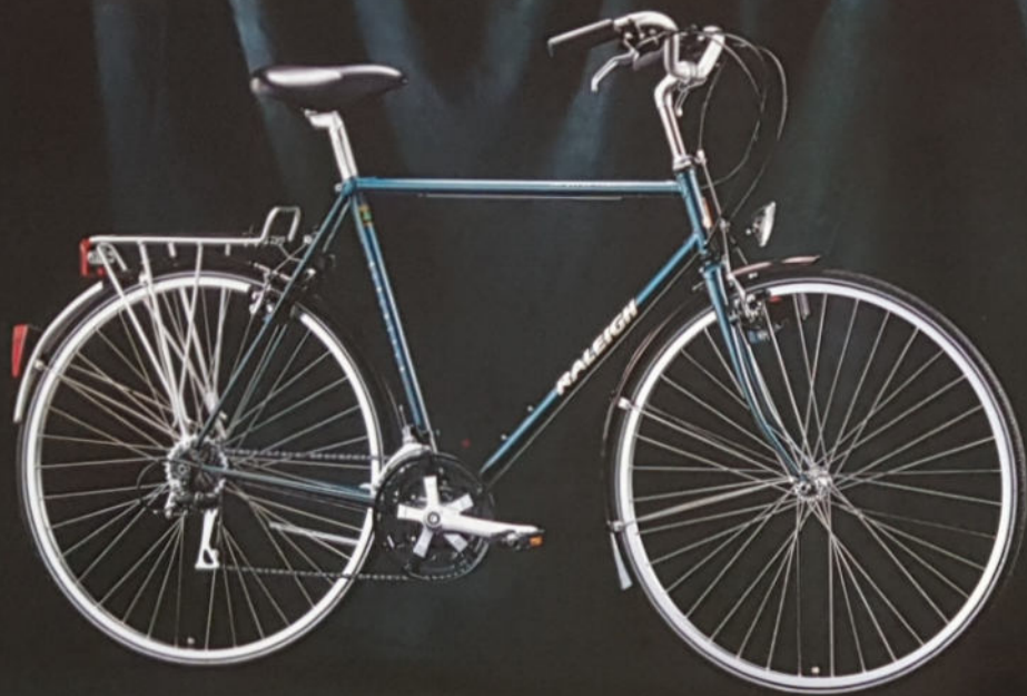
EXECUTIVE H 56/58/60, D 54/57, Rahmenmaterial Reynolds 531, Altus A 20.