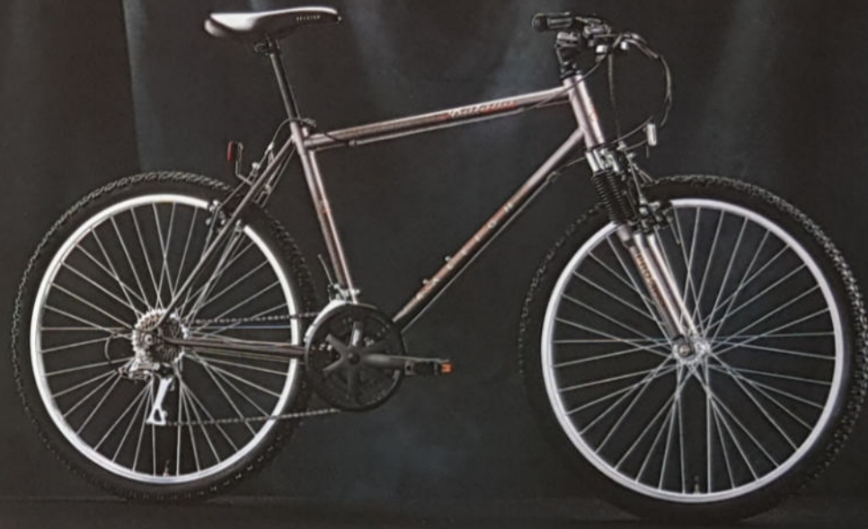
KATANA H 43/48/53/58, Rahmenmaterial Cro-Mo gelötet, Shimano C50, 18-Gang STI, Dual SIS.