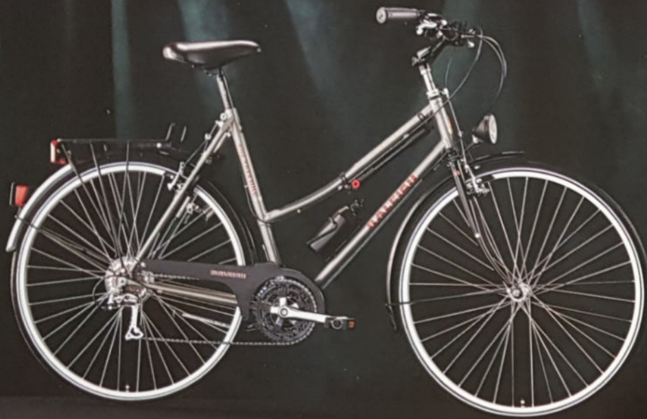
▲ ONE TREE HILL H 57/60/65, D 54/57, Rahmenmaterial Cro-Mo, Shimano Alivio.