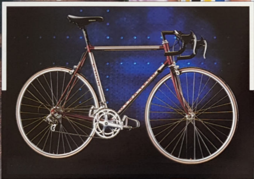
AC1000 H 49/52/54/57/59/62. Rahmenmaterial Titan/ Cro-Mo/Alu, Campa Stratos.