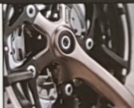
▲ FM 6000 CITY H 49/54/59, D 46/51/56, Rahmenmaterial Raleigh 18-23 gelötet, Sachs Torpedo 3 x 7.