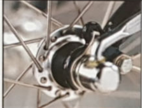
▲ BLUE SKY H 57/60/65, D 54/57, Rahmenmaterial Cro-Mo, Shimano STX.