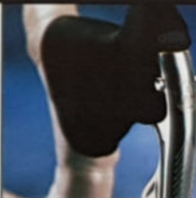
SH3000 H 49/52/54/57/59/62, Rahmenmaterial Titan/ Cro-Mo/Alu, Shimano 105 STI.