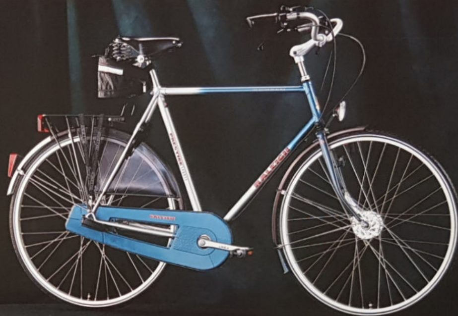
PRESTIGE H 57/60, D 54/57, Rahmenmaterial Reynolds 501, Sachs 7-Gang.