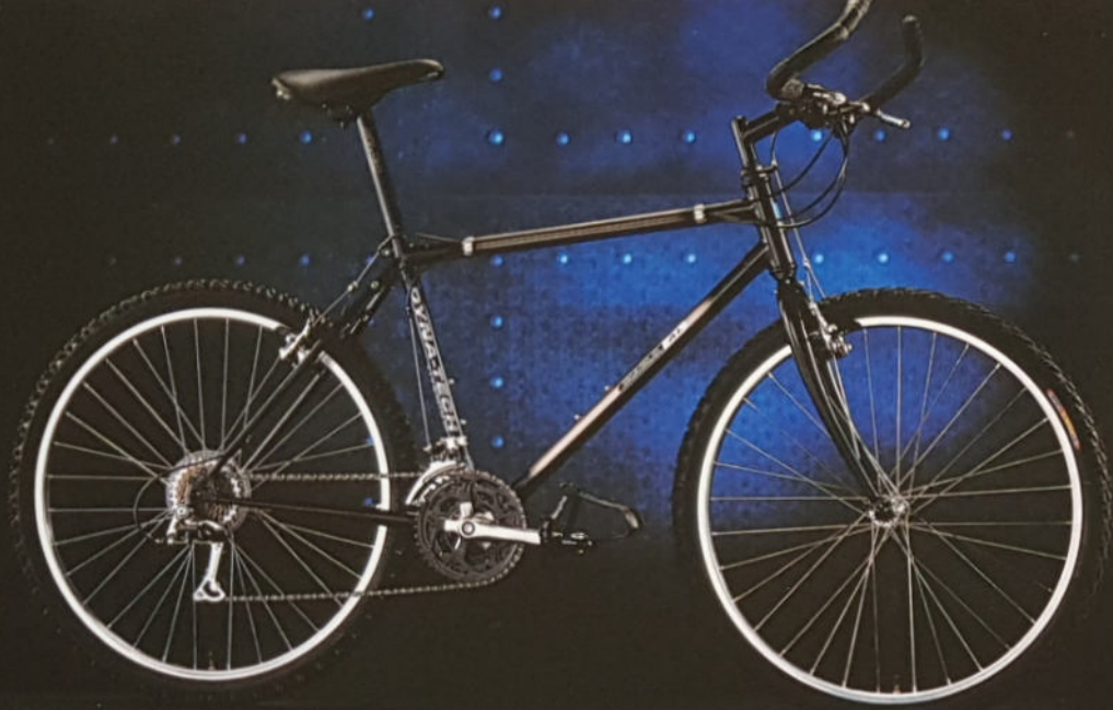
DIABLO AL H 40/43/45/49, Rahmenmaterial Duo-Tech Titan/Cro-Mo, Shimano Alivio STI.