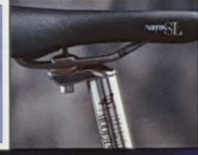
DIABLO LX H 40/43/45/49, Rahmenmaterial Duo-Tech Titan/Cro-Mo, Shimano Deore LX. Dieses Modell wird mit der Suntour- Federgabel Duo Track 8001 geliefert!