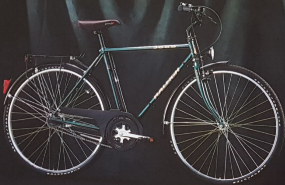
FM 3000 CITY H 54/59, D 46/51/56, Rahmenmaterial Raleigh 18-23 gelötet, Sachs 5-Gang mit Klickbox.