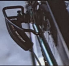
FM 5000 CITY H 49/54/59, D 46/51/56, Rahmenmaterial Raleigh 18-23 gelötet, Sachs Super 7 mit Klickbox.