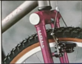
DIABLO STX H 40/43/45/49, Rahmenmaterial Duo-Tech Titan/Cro-Mo, Shimano STX.