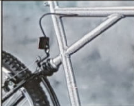
ACTIVATOR II H 41/45/49/53, Rahmenmaterial Hi-Ten, Shimano C50.