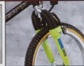
HEAT 20" J 28, M 28, Rahmenmaterial Raleigh Junior MTB Hi-Ten, Shimano 5-Gang Index Gearing.