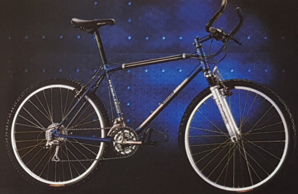
DIABLO SE H 40/43/45/49, Rahmenmaterial Duo-Tech Titan/Cro-Mo, Shimano STX SE.