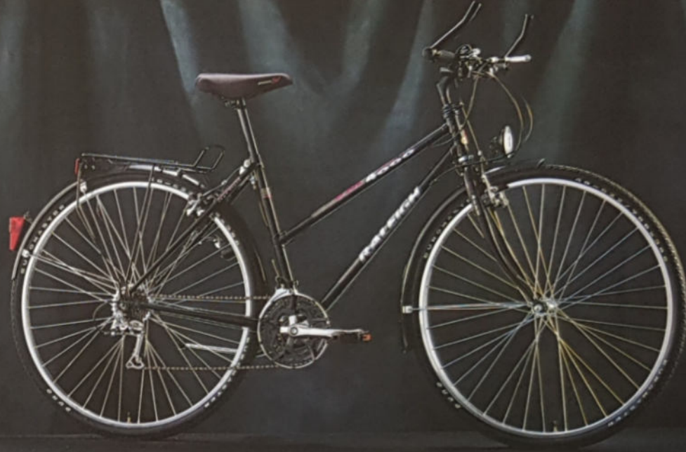
▲ FM 4000 CITY H 49/54/59, D 46/51/56, Rahmenmaterial Raleigh 18-23 gelötet, Shimano Alivio/STX SE.