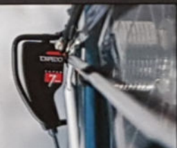
CONTINENTAL H 57/60/65, D 54/57, Rahmenmaterial Hi-Ten, Sturmey-Archer 5-Gang.