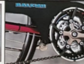
▲ FM 8000 CITY H 49/54/59, D 46/51, Rahmenmaterial Reynolds 501, Shimano Deore LX.