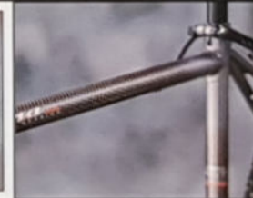
KALAHARI H 43/48/53/58, Rahmenmaterial Cro-Mo gelötet, Shimano Alivio STI.