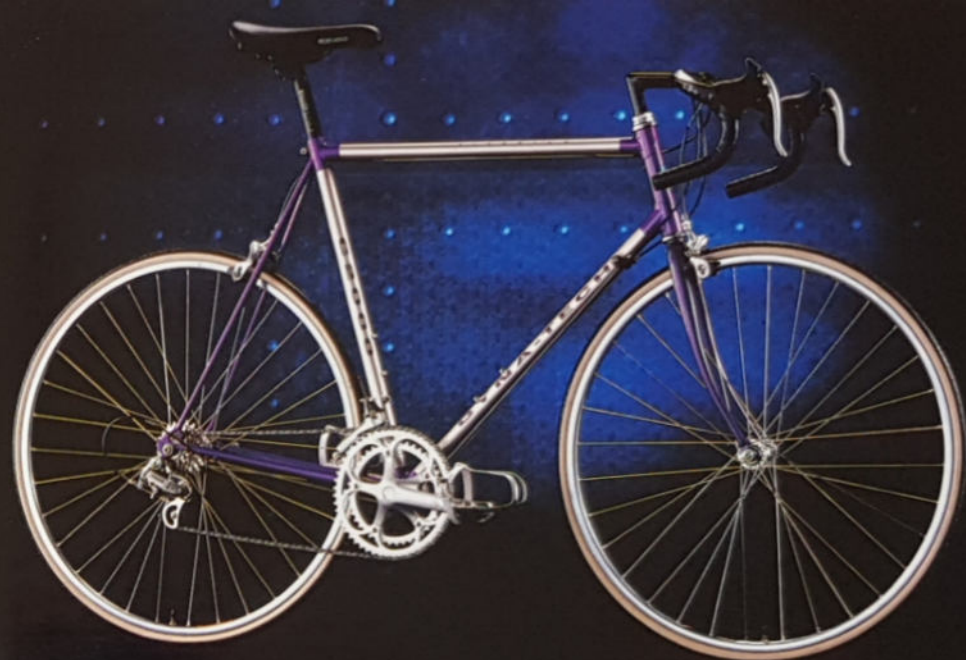
C2000 H 49/52/54/57/59/62, Rahmenmaterial Titan/ Cro-Mo/Alu, Campa Veloce.