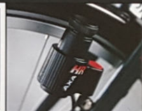
WAYFARER H 57/60/65, D 54/57, Rahmenmaterial Reynolds 501, Sachs Orbit 14-Gang.