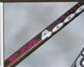
▲ FM 2000 CITY H 49/54/59, D 46/51/56, Rahmenmaterial Raleigh 18-23 gelötet, Shimano C50/TY30.