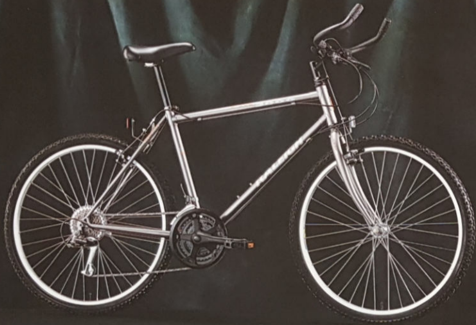
FM 5000 H 39/43/48/53/58, Rahmenmaterial Cro-Mo, Sachs 3000 Power Push.