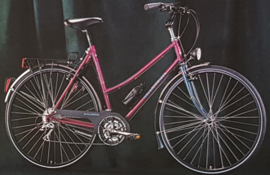
▲ KEY WEST H 57/60/65, D 54/57, Rahmenmaterial Cro-Mo, Shimano STX SE.