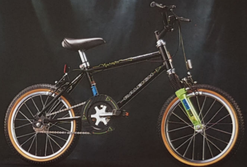
ACTIVATOR 16" RH 27, Rahmenmaterial Raleigh Junior MTB, 1-Gang.