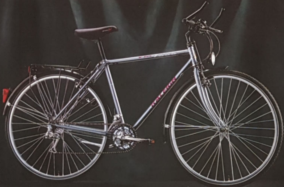
▲ FM 7000 CITY H 49/54/59, D 46/51, Rahmenmaterial Reynolds 501, Shimano STX SE.