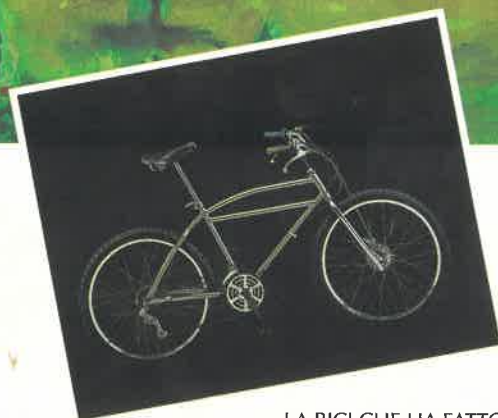
LA BICI CHE HA FATTO STORIA